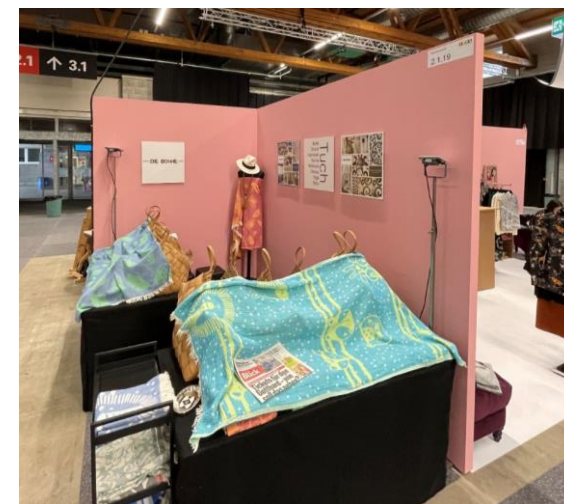
Olma-Wände mit farbigem Anstrich