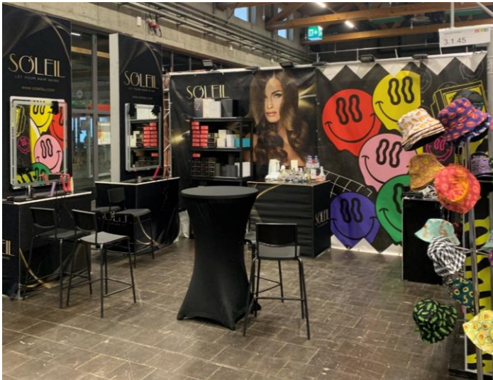
Standfläche ohne Bodenbelag

Für eine bessere Wirkung empfehlen wir einen Teppich- oder PVC-Boden zu verlegen. Dieser kann selber mitgebracht oder bei uns als Dienstleistung via OSC bestellt werden.