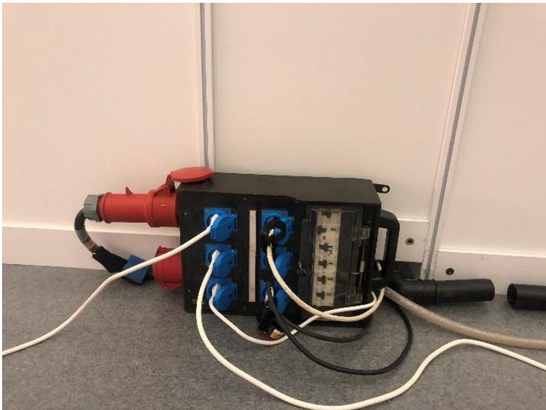
Grundinstallation Elektroanschluss (variiert, je nach bestelltem Anschluss)

Bei den Anschlüssen handelt es sich um Grundinstallationen. Die Platzierung wird mittels Standskizze durch den Ausstellenden definiert. Alle weiteren Verkabelungen ab dem Anschluss sind Sache des Ausstellenden.