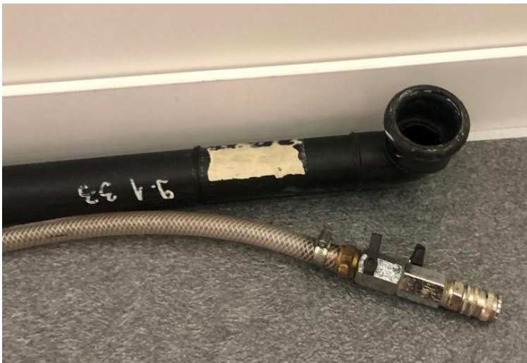
Grundinstallation Wasseranschluss (variiert, je nach bestelltem Anschluss)

Bei den Anschlüssen handelt es sich um Grundinstallationen. Die Platzierung wird mittels Standskizze durch den Ausstellenden definiert. Alle weiteren Leitungen sind Sache des Ausstellenden.