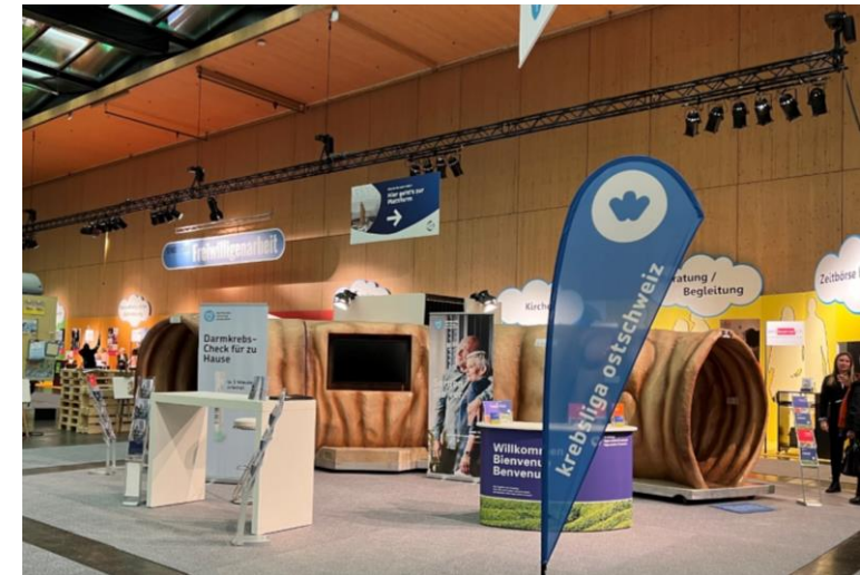
Beleuchtungskonzept von Scandola