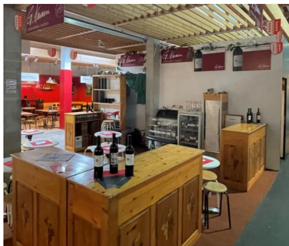
Olma-Wände mit weissem Anstrich