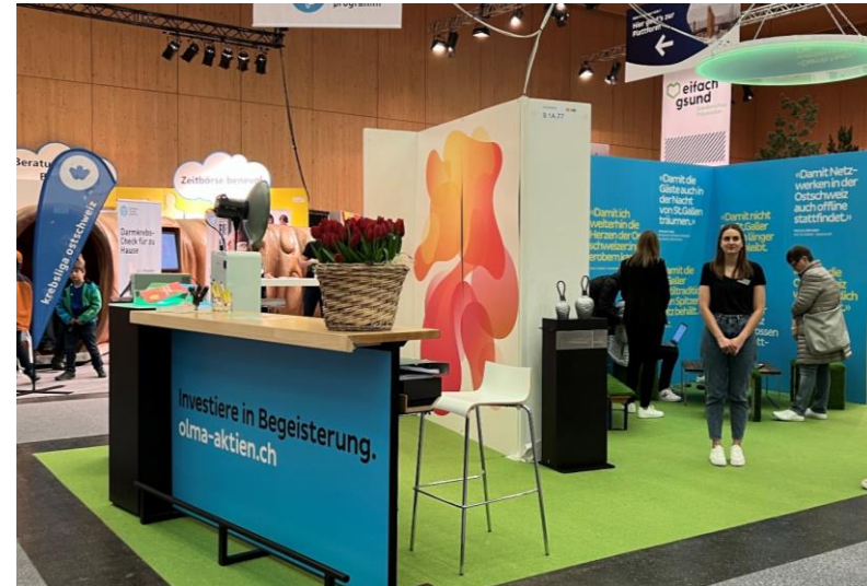
Standfläche mit Teppich Rewind