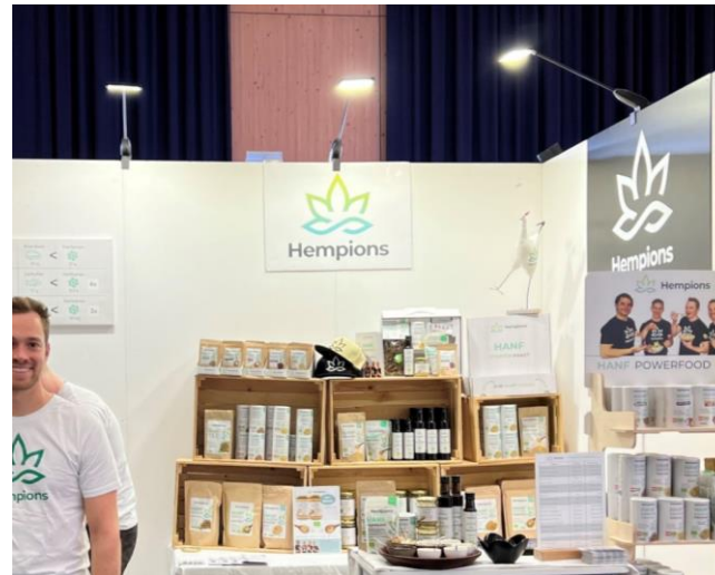
Beleuchtung mit Auslegersspots